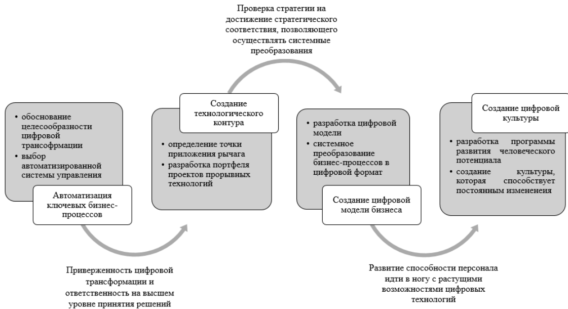
Рис. 3. Модель цифровой трансформации

Автоматизация процессов с применением цифровых технологий и называется цифровизацией.