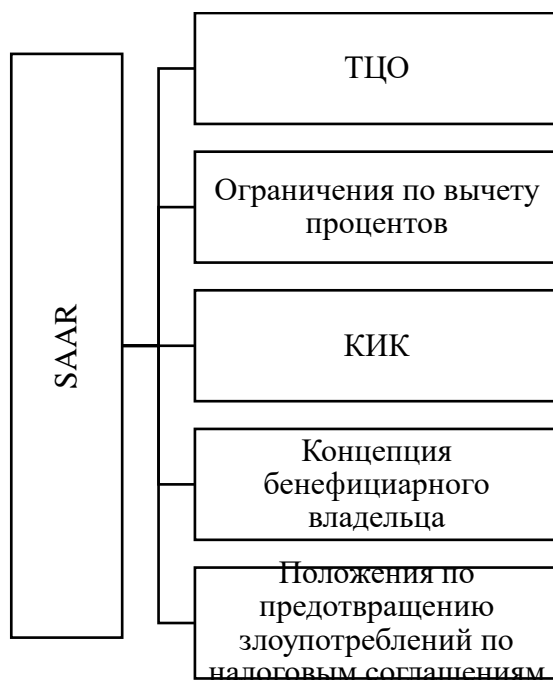
Рисунок 2. Специальные антиуклонительные меры в Казахстане

Существуют ограничения по вычету процентов в форме правила тонкой капитализации. Данное правило используется в отношении процентов, которые выплачиваются взаимозависимым лицам и не позволяет в полном объеме учитывать проценты в качестве расходов по налогу на прибыль организаций. Выплаченные проценты подлежат вычету, если отношение контролируемой задолженности к собственному капиталу не превышает 4:1 (7:1 для банков, страховых организаций).