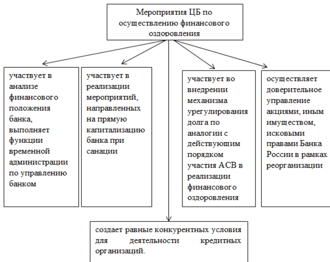
Рис. 3. Мероприятия ЦБ по осуществлению финансового оздоровления кредитных организаций

Антикризисное управление кредитных организаций в Западных странах является распространённым явлением, требующим применения широкого спектра знаний и опыта в области корпоративного менеджмента, финансов, права, маркетинга, психологии и многих других дисциплин. Специалисты в этой области - одни из самых высокооплачиваемых. На данный момент процедуры реструктуризации должника с целью финансового оздоровления предусмотрены законодательством более 80% западных стран. Зарубежные банки принимают такие основные мероприятия по финансовому оздоровлению кредитных организаций, как: